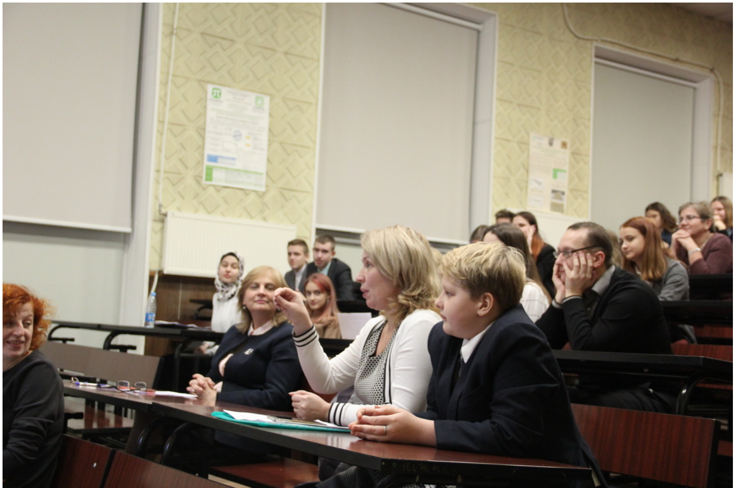
После проведения первой части Конференции была проведена экскурсия для школьников в лаборатории Высшей школы.